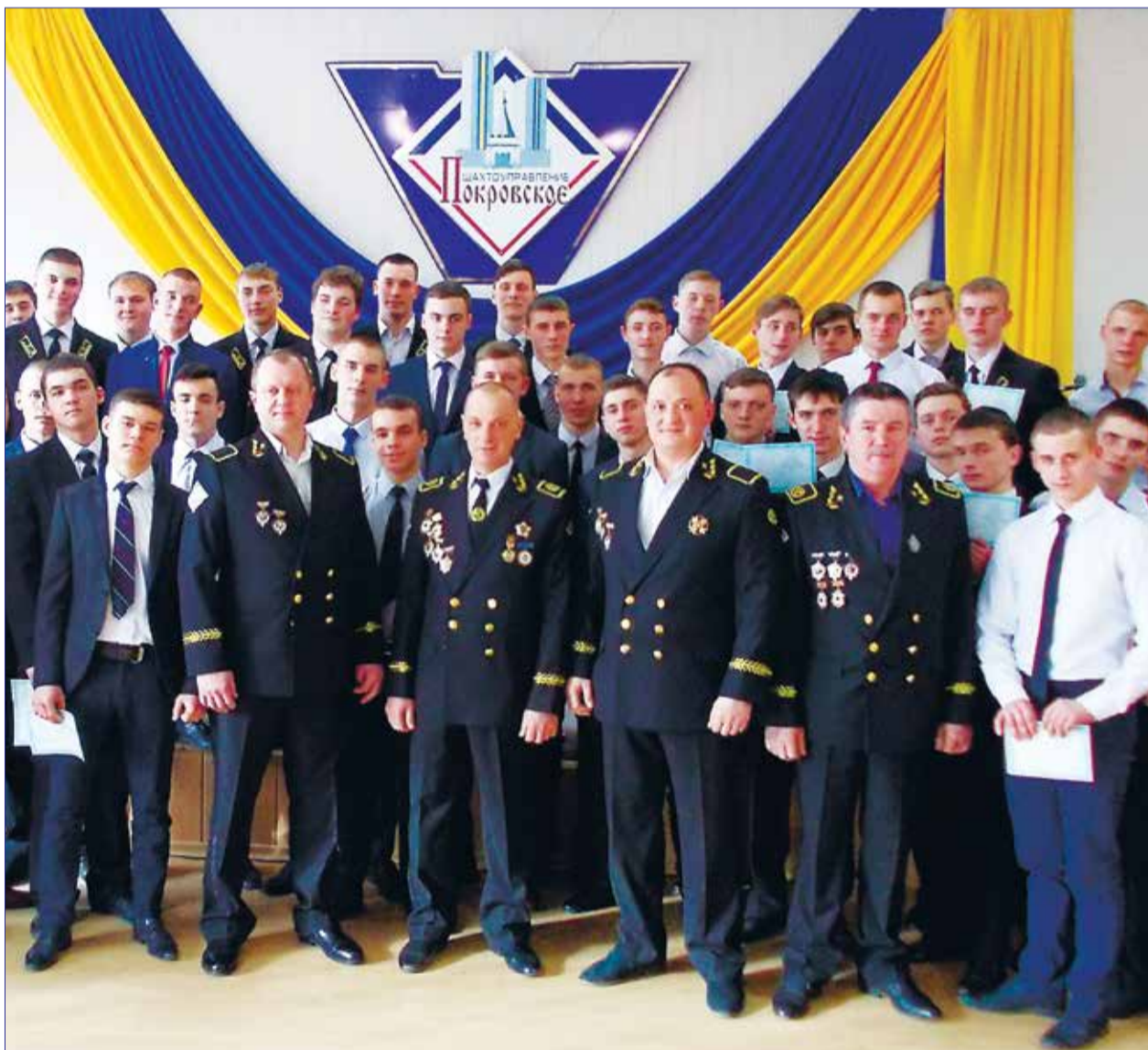
С получением дипломов выпускников Покровского профессионального лицея поздравили самые опытные горняки ПАО «Шахтоуправление «Покровское».

Подготовка новых кадров и работа с молодыми горняками - важные направления деятельности ПАО «Шахтоуправление «Покровское». На них предприятие делает особый акцент. Угольщики давно сотрудничают с профильными учебными заведениями, которые готовят специалистов для горной промышленности. Покровский профессиональный лицей - один из них.