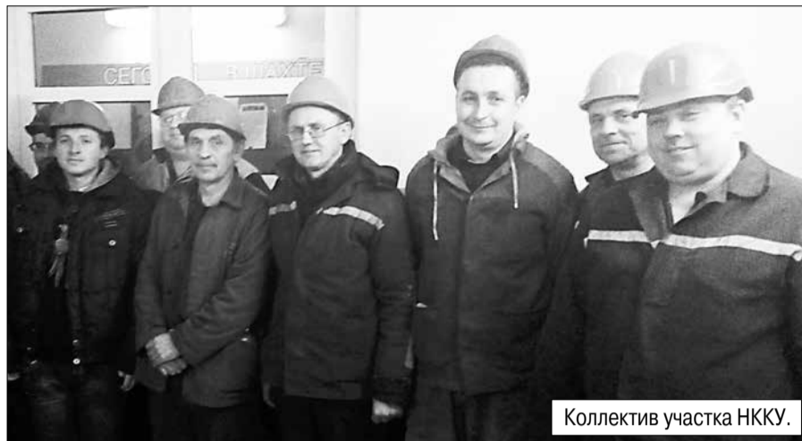
Коллектив участка НККУ.

География работ коллектива участка большая – это и главный ствол, и ВПС-1, и ВПС-2, и ВПС-3, и комплекс насосной станции I-II подъема в селе Сергеевка, и комплекс прудонакопителя в селе Ново-Сергеевка, и насосная станция поселка Шевченко, и вентиляционный ствол.