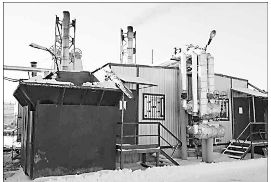
Обеспечение качественным теплом производственных объектов предприятия является одной из важнейших задач, решаемых в шахтоуправлении «Покровское».

Материал полосы подготовили Елена Денисенко, Александра Шелест. ■